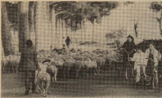
Il parco della Caffarella