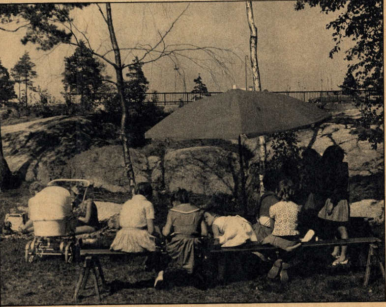
Stoccolma, La famiglia al campeggio.