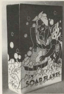
UNA NOSTALGICA CONFEZIONE DI SAPONE IN SCAGLIE, STUDIATA PER I MAGAZZINI LONDINESI.