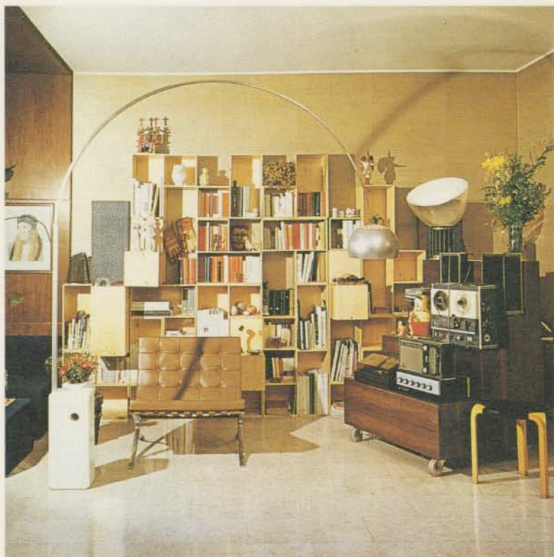
"PER CHI PROGETTARE?", REALIZZAZIONE DELL'ARCHITETTO E. LUCINI (DA INTERNI N. 25, GENNAIO 1969).