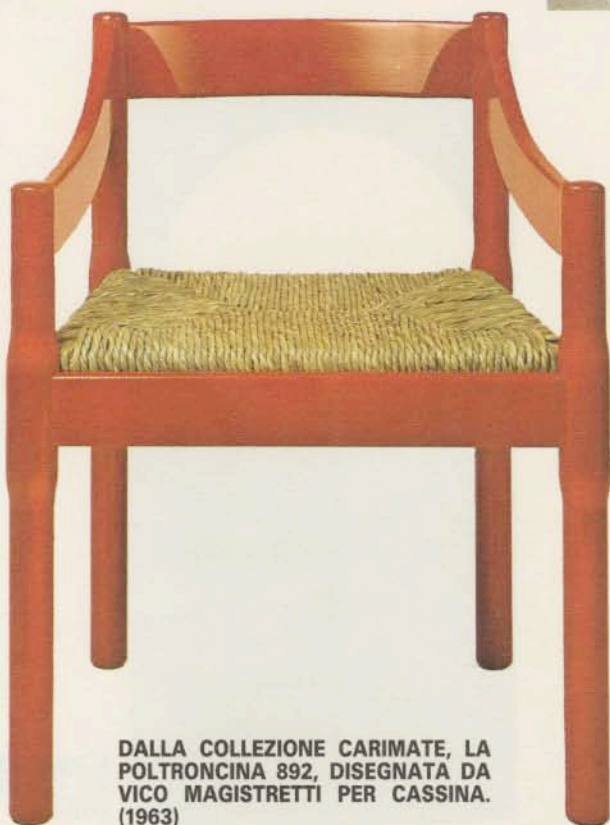
DALLA COLLEZIONE CARIMATE, LA POLTRONCINA 892, DISEGNATA DA VICO MAGISTRETTI PER CASSINA. (1963)