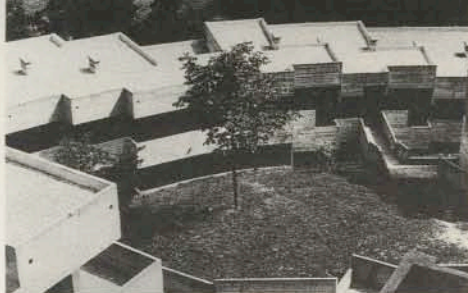
L'IMPEGNO SOCIALE È IL TEMA DOMINANTE DEL PROGETTO DI G. DE CARLO PER I COLLEGI UNIVERSITARI DI URBINO. (1965)