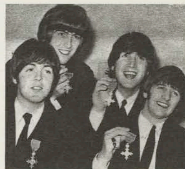
MOMENTO D'ORO PER I BEATLES, CHE VENGONO NOMINATI BARONETTI DALLA REGINA ELISABETTA. (1962)