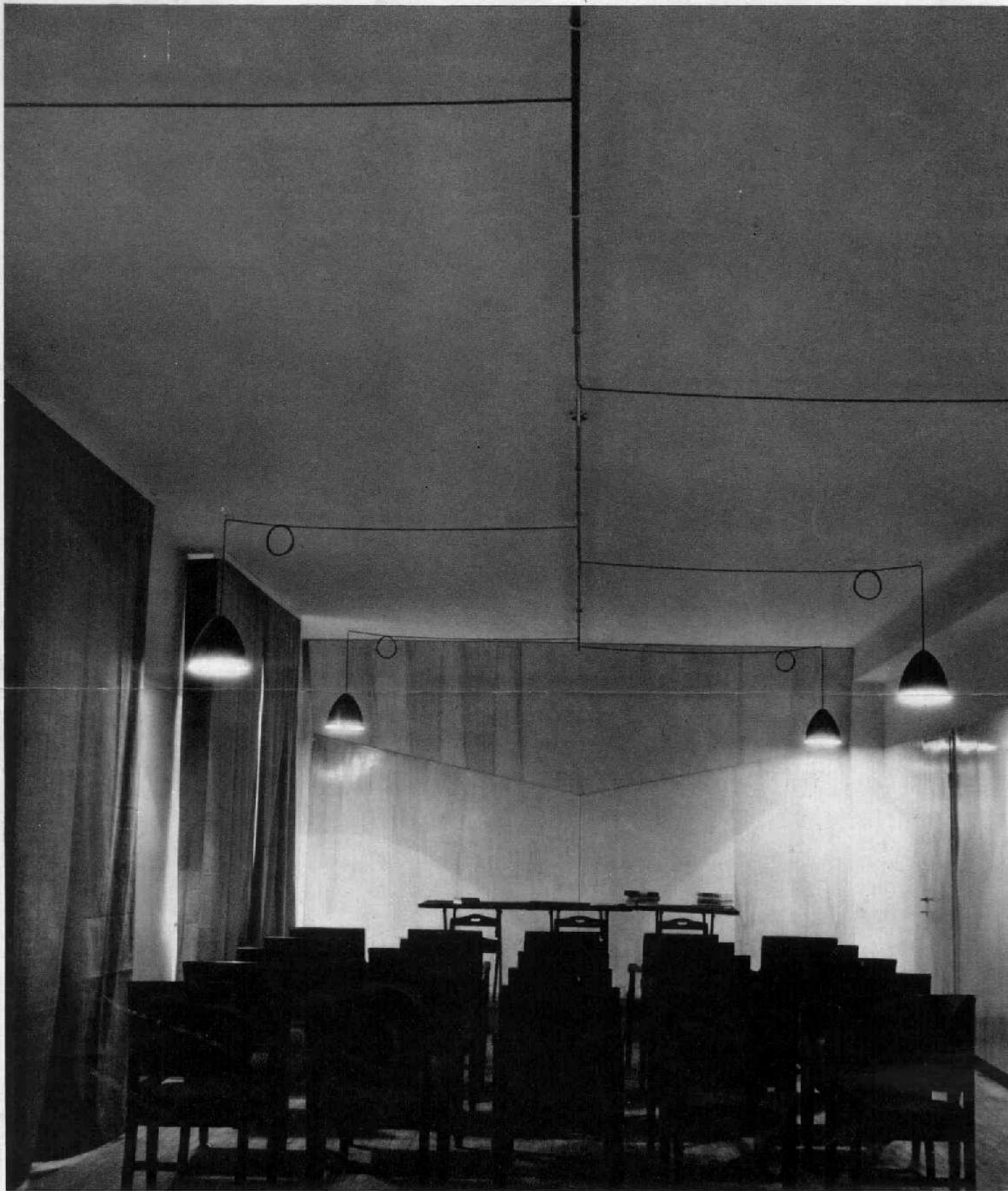
La sala vista dall'ingresso: pareti di compensato di pioppo naturale, lampade in ferro luccato, tende in tela kaki.