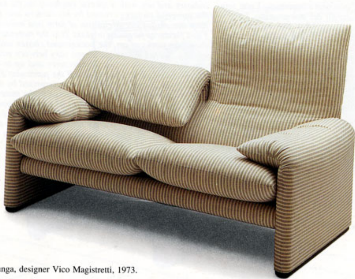
Maralunga, designer Vico Magistretti, 1973.